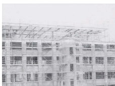
Jan Kopp Constellations Ordinaires 12 mai-7 juillet 2012