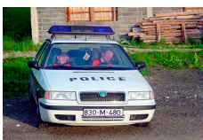
Hit-and-Run carte blanche à Stéphane Bérard 5 novembre-7 janvier 2012