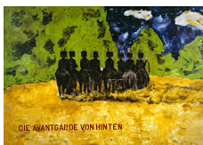
Werner Büttner Die Avantgarde von hinten 14 janvier-10 mars 2012