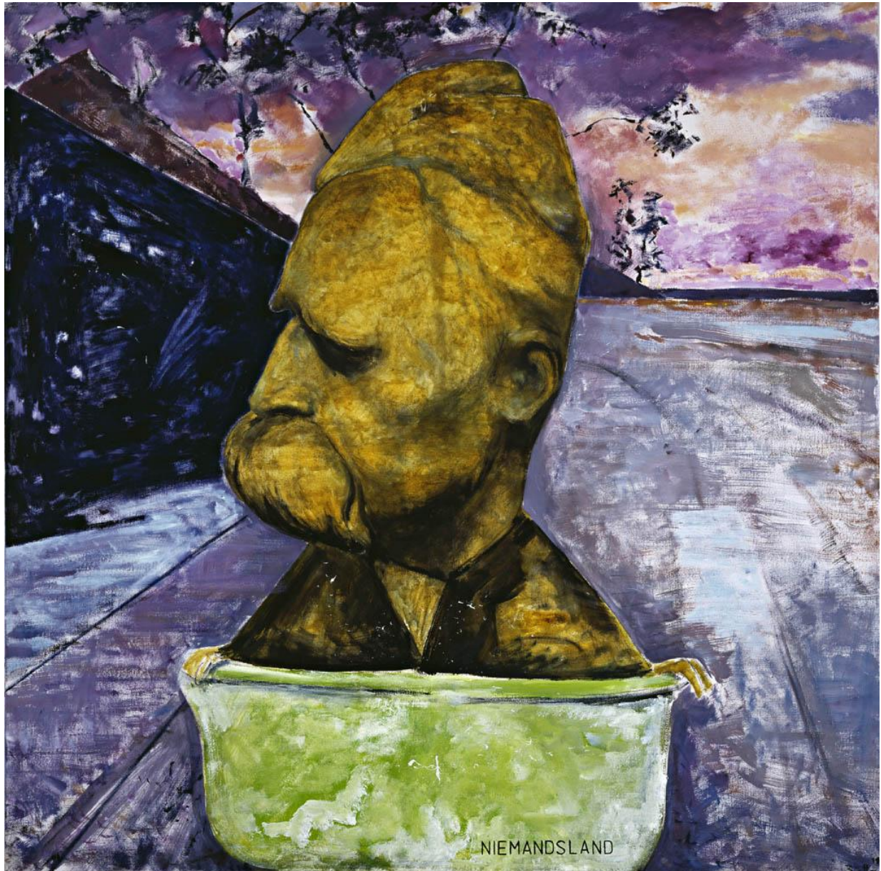
Niemansland (Noman's land) , 2011 Huile sur toile / Oil on canvas, 190x190cm © Egbert Haneke Courtesy Werner Büttner - Marion Meyer Contemporain