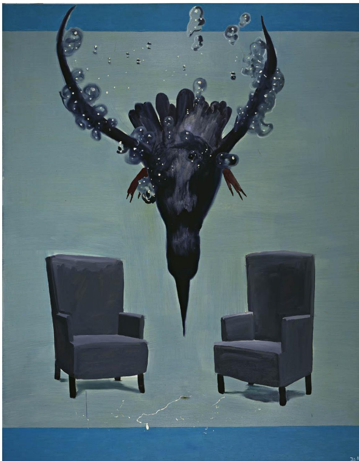
Die Eisvogelattacke (L'attaque de l'oiseau de glace), 2011 Huile sur toile / Oil on canvas © Marion Meyer Contemporain Courtesy Werner Büttner - Marion Meyer Contemporain