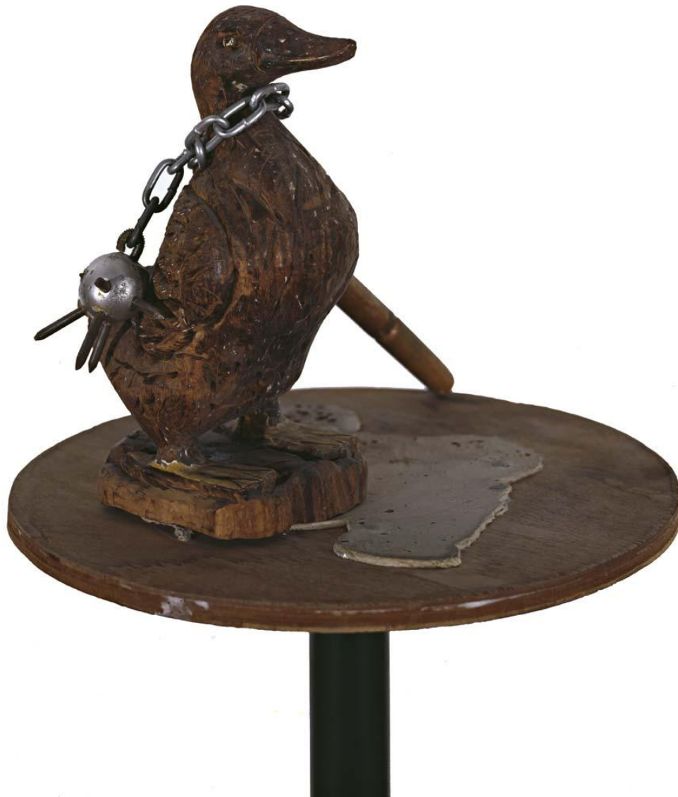
Am Anfang war eine Ente, und diese Ente schuf eine andere Ente...(Schöpfungsmythos der Abakan -Tartaren), 1983 Bois, fer, 38 x 38 x 30 cm, © Egbert Haneke Courtesy Werner Büttner - Marion Meyer Contemporain