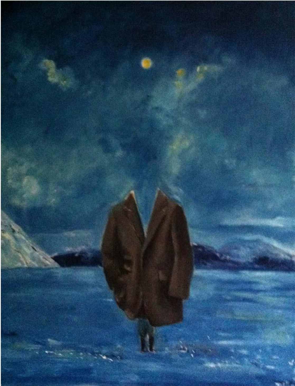
Entrücktheit für Fortgeschrittene , 2011 Huile sur toile / Oil on canvas © Egbert Haneke Courtesy Werner Büttner - Marion Meyer Contemporain