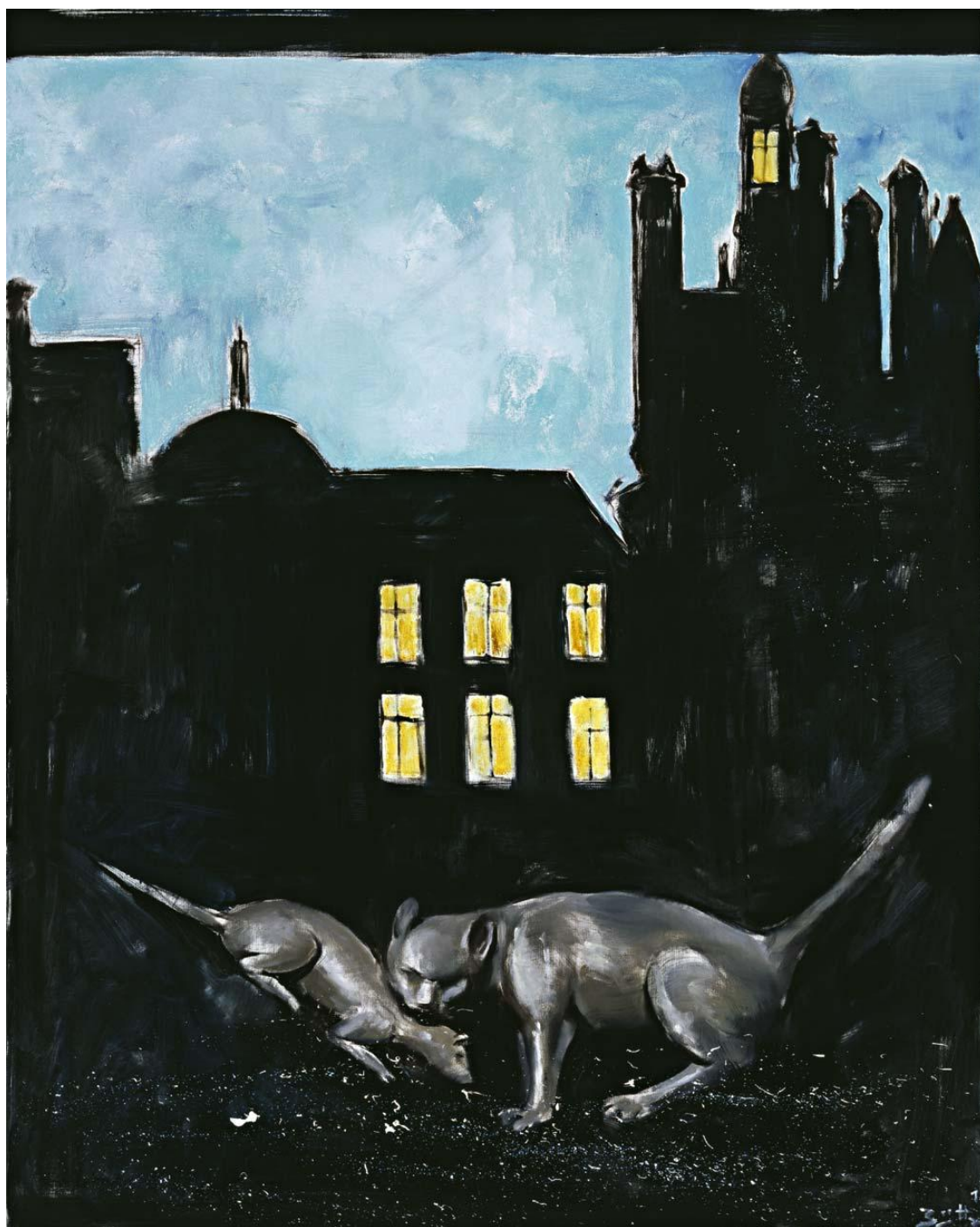
Vive la bagatelle , 2011 Huile sur toile, 150 x 120 cm © Egbert Haneke Courtesy Werner Büttner - Marion Meyer Contemporain