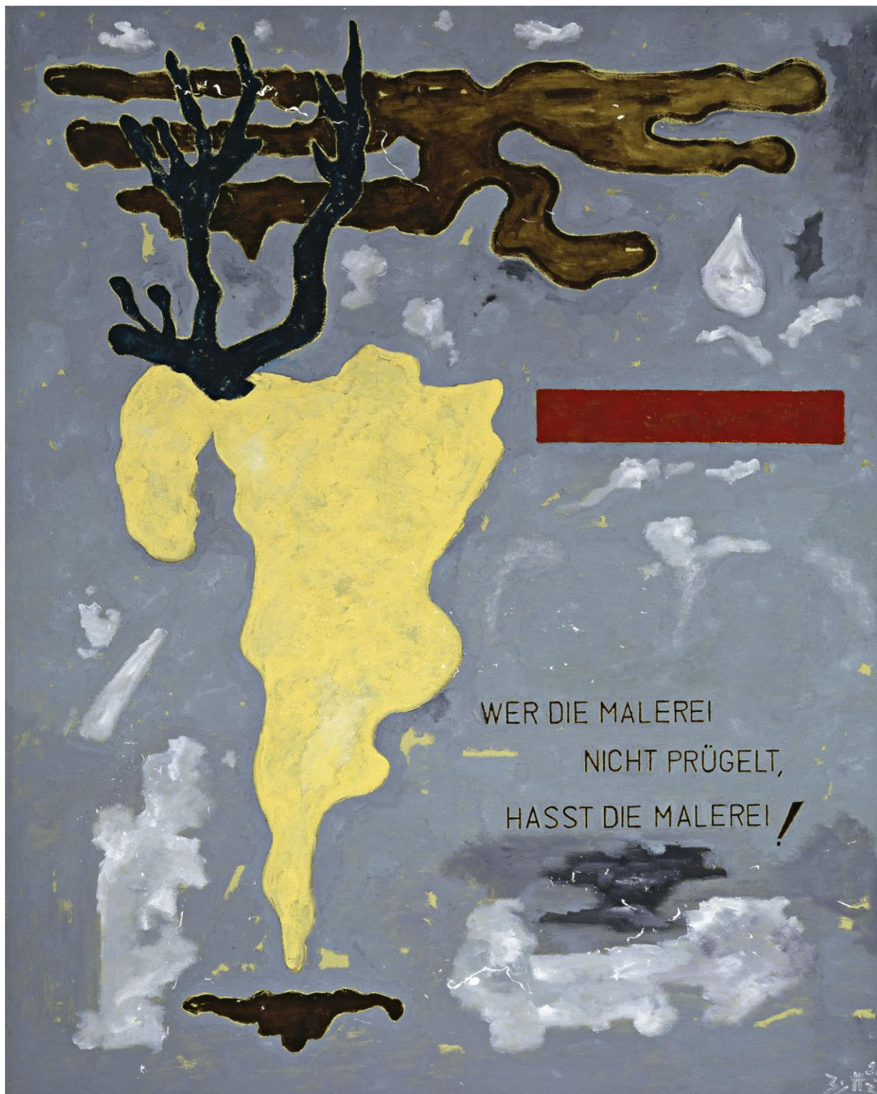
Wer die Malerei nicht prügelt, Hasst die Malerei (Celui qui bat pas la peinture, haine la peinture) 2011 Huile sur toile / Oil on canvas © Egbert Haneke Courtesy Werner Büttner - Marion Meyer Contemporain