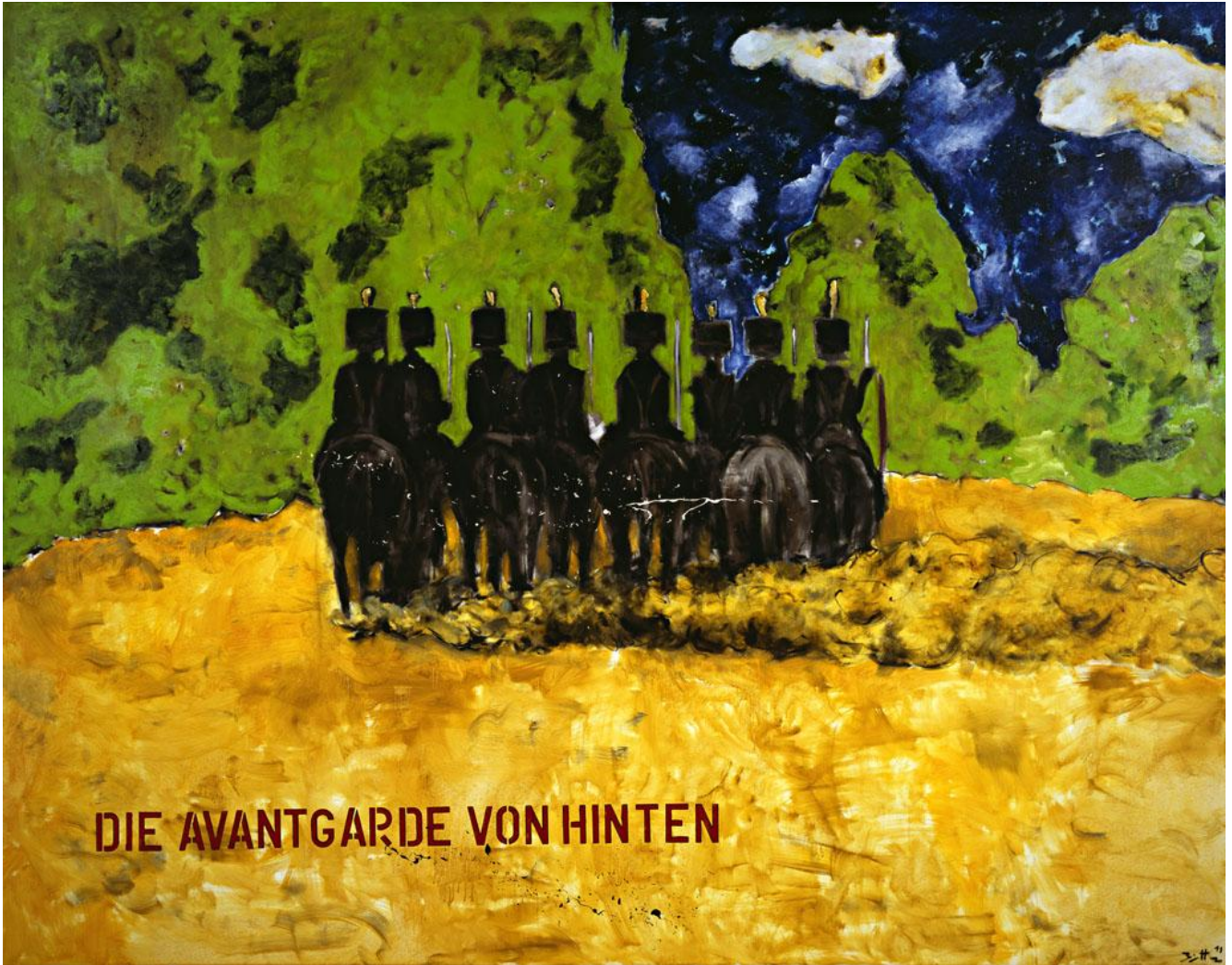
Die Avantgarde von Hinten (les avant-gardes de derrière) , 2011 Huile sur toile / Oil on canvas, 300 x 200 cm © Egbert Haneke Courtesy Werner Büttner - Marion Meyer Contemporain