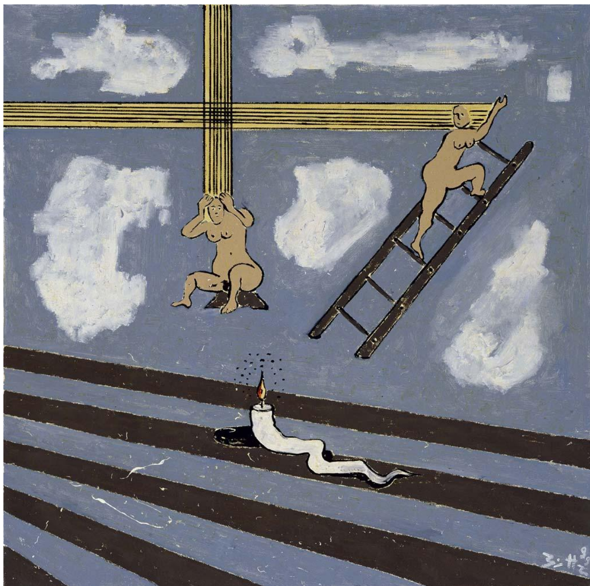
Das leckere Ungeheuer / Le Monstre délicieux , 1999 Huile sur toile, 50 x 50 cm