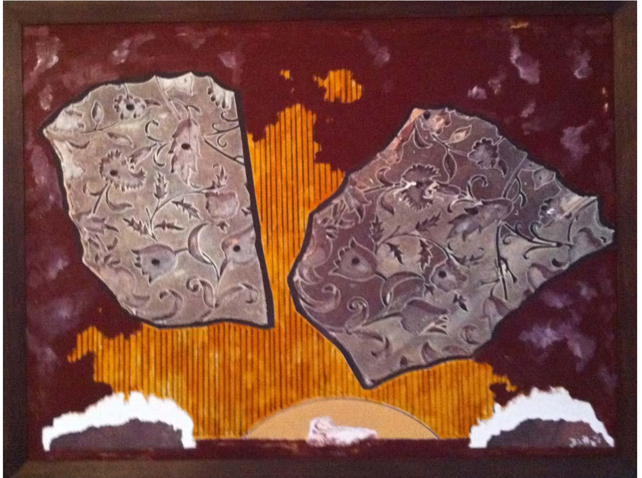
Nachdenkliche Betrachtung eines Neugeborenen (observation pensive d'un nouveau né), 2011 Huile sur toile et collage / Oil on canvas and collage, 50 x 80 cm © Egbert Haneke Courtesy Werner Büttner - Marion Meyer Contemporain