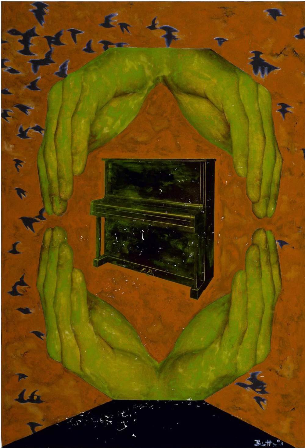
Das vereidigte Piano (Le piano assermenté), 2011 Huile sur toile / Oil on canvas, 180x120cm © Egbert Haneke Courtesy Werner Büttner - Marion Meyer Contemporain