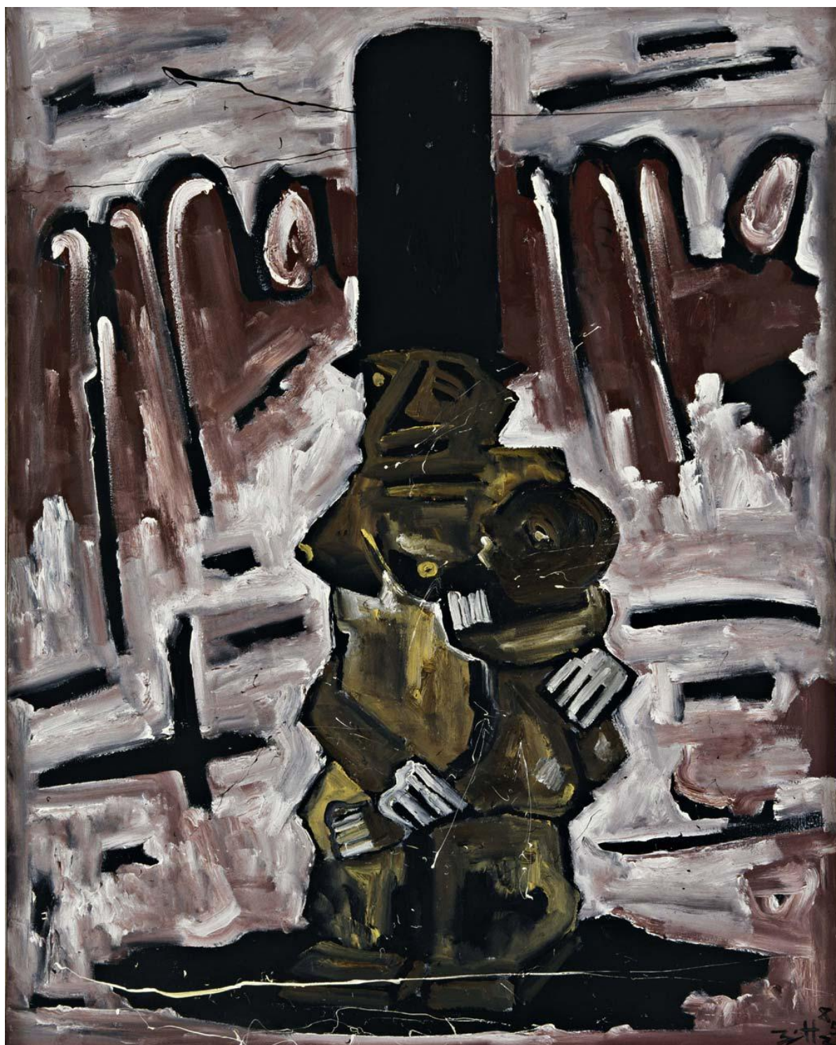
Mama , 1985 Huile sur toile, 190 x 150 cm © Egbert Haneke Courtesy Werner Büttner - Marion Meyer Contemporain