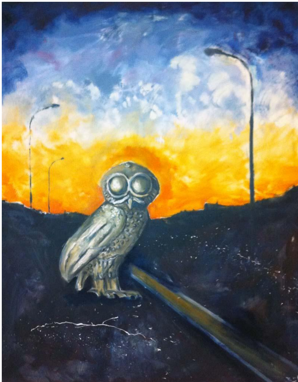
Schlecht beleuchter Weg der Weisheit (Chemin de la sagesse mal illuminé) , 2011 Huile sur toile / Oil on canvas, 150 x 120 cm © photo Marion Meyer Contemporain Courtesy Werner Büttner - Marion Meyer Contemporain